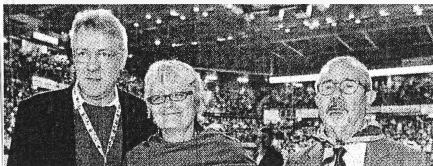
Landini, Furian e Barbagallo, leader di Cgil, Cisl e Uil

3 Proposta Tridico (Inps) Superare l'età di pensionamento uguale per tutti, prevedendo un'età di uscita dal lavoro per ogni categoria, applicando coefficienti di gravosità specifici. Stabilire l'aspettativa di vita alla nascita e non a 65 anni. E poi bloccarla da una certa età in poi