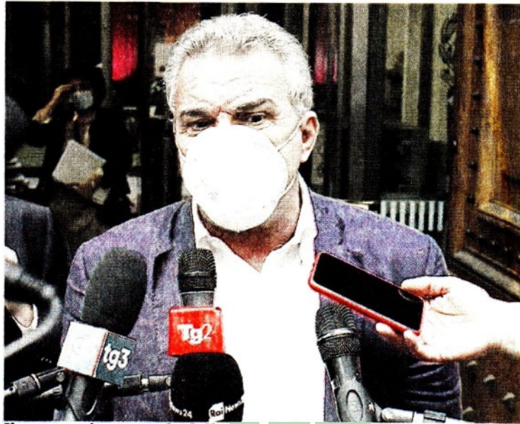
Il segretario generale della Cisl, Luigi Sbarra

ARTICOLO NON CEDIBILE AD ALTRI AD USO ESCLUSIVO DEL CLIENTE CHE LO RICEVE - 2883