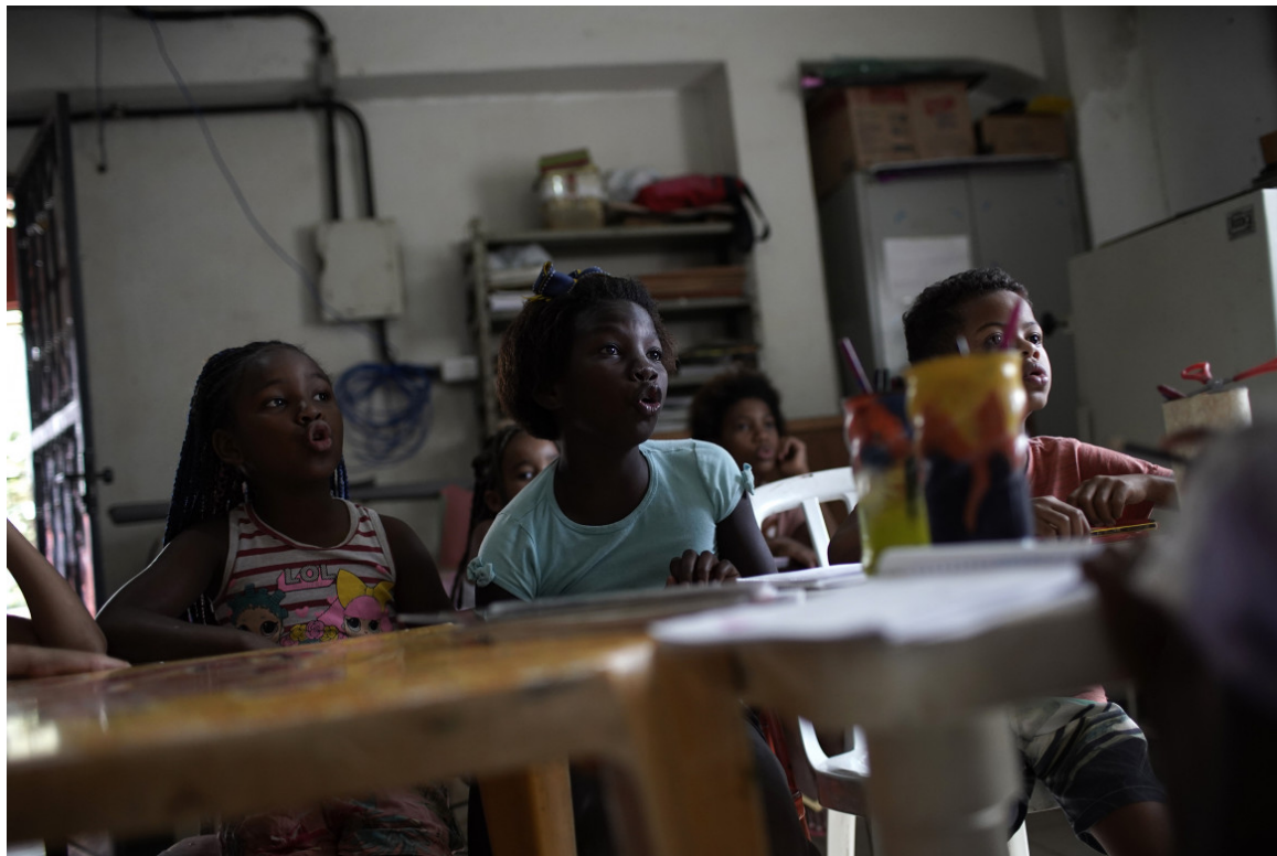
Bambini a lezione in una scuola di Rio

Intervista. Parla Frei Betto, il frate domenicano, teologo della liberazione, educatore e militante politico. «A settembre, saranno 100 anni dalla nascita del pedagogista e teorico: l'educazione popolare può ancora rendere gli oppressi protagonisti della scena sociale»