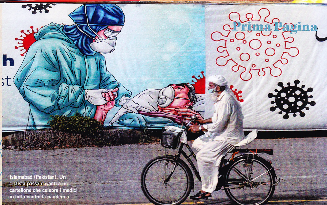
Islamabad (Pakistan). Un ciclista passa davanti a un cartellone che celebra i medici in lotta contro la pandemia

Paesi in via di sviluppo. La "People Vaccine Alliance" ( https://peoplesvaccine.org/ ) e "Right2cure. Nessun profitto sulla pandemia" ( www.noprofitonpandemic.eu ) sono coalizioni di attivisti e di organizzazioni internazionali - tra cui Emergency - che si sono mobilitate per un equo accesso ai vaccini contro il Covid-19. Perché il vaccino sia disponibile per il maggior numero di persone è indispensabile aumentare la produzione e abbassare i prezzi: un risultato che potrebbe essere raggiunto se le regole che tutelano la proprietà intellettuale venissero - almeno temporaneamente - sospese (come è previsto per le situazioni di emergenza anche dall'articolo 9 dell'accordo di Marrakech all'origine dell'Organizzazione Mondiale del Commercio), o se le farmaceutiche concedessero licenze ad aziende terze. Non andrebbero in perdita: ci guadagnerebbero solo un po' meno. Non sarebbe la prima volta che una grande mobilitazione internazionale riesce a influenzare decisioni in questo contesto. Negli anni '90, i farmaci antiretrovirali erano prodotti negli Stati Uniti a un prezzo proibitivo per i malati del Sud del mondo. Più di 12 milioni di persone morirono in Africa in 10 anni per complicazioni legate all'Aids prima che si arrivasse alla produzione di trattamenti generici veramente accessibili: 100 euro l'anno contro i precedenti 10 mila. È solo grazie alle battaglie per i trattamenti generici, che oltre 20 milioni di malati nel mondo hanno la possibilità di curarsi.