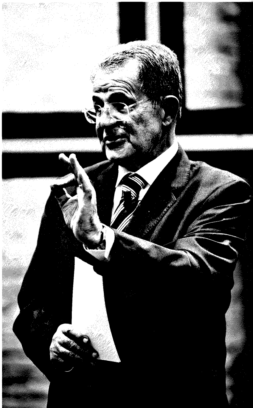
Romano Prodi. 72 anni, è stato presidente della Commissione Europea dal 1999 al 2004

Credo che il ruolo dell'Italia sia cresciuto molto negli ultimi mesi. È un ruolo fondamentale e importantissimo per costruire una piattaforma unica sui più delicati temi europei di cui abbiamo parlato finora, che sia frutto del miglior compromesso possibile. Un disegno che includa anche la Spagna, che ha un problema più grave del previsto in tema di bolla immobiliare, e un problema di debito che tuttavia partiva da