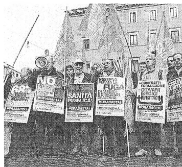
Camici bianchi Il sit in di ieri davanti al ministero (Ansa)

Marini chiede che il vuoto lasciato dall'esodo venga colmato dallo sblocco del turn over, con nuove assunzioni. Altrimenti si rischia di grosso. In due grossi ospedali della Calabria «due primari sono