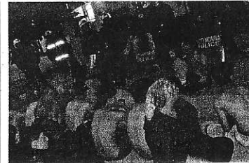
Semi-nudi e sorvegliati Un gruppo di migranti sgoberati da Idomeni viene trasferito sotto la sorveglianza della polizia ellenica