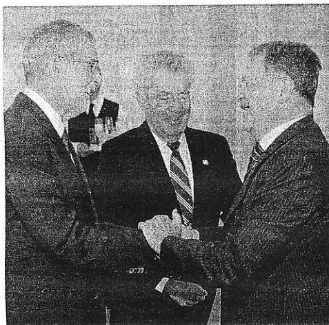
L'incontro Alexander Van der Bellen, Heinz Fischer e Romano Prodi

In Austria hanno scampato un grande pericolo. C'è stata una insperata riflessione e reazione dell'agente che ha scongiurato la vittoria della destra xenofoba di Norbert Hofer. Romano Prodi, ex premier ed ex presidente della Commissione Ue, parla al Fatto da Astana, Kazakistan, nel pieno dell'Economic Summit in compagnia di politici, economisti, scienziati e premi Nobel. Prima di arrivare ad Astana, Prodi ha fatto tappa a Vienna per una conferenza agli ex allievi della John Hopkins. E ha incontrato il nuovo presidente Van der Bellen. "Sono stato invitato a una colazione dal presidente uscente Heinz Fischer, sono stato molto felice quando mi ha comunicato che avrebbe partecipato anche il nuovo presidente Alexander Van der Bellen, reduce da questa straordinaria vittoria elettorale".