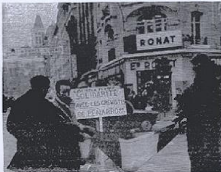
● Les travailleurs de l'entreprise « Penarroya » collectant rue de la République.

Les 200 travailleurs de l'usine Penarroya (Béthune) de Saint-Denis sont en grève depuis le 20 janvier et occupent leur usine.