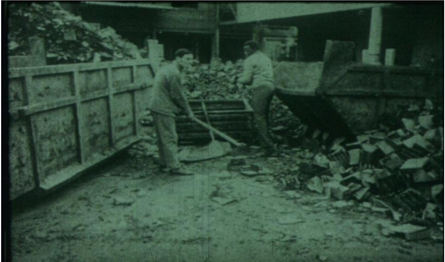
À l'usine Peñarroya de Saint-Denis, au nord de Paris, en 1971