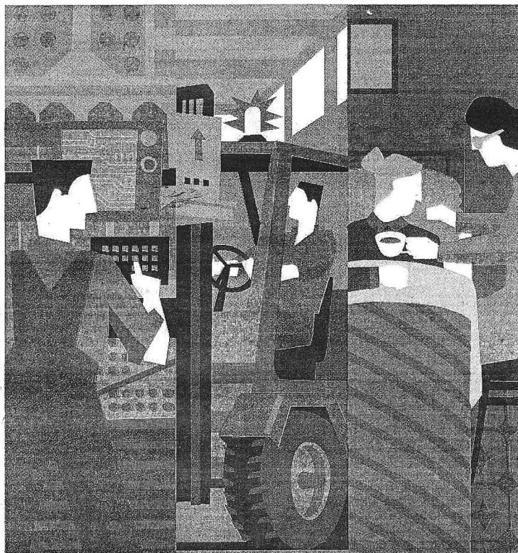
Illustrazione di GIUNO ROSA