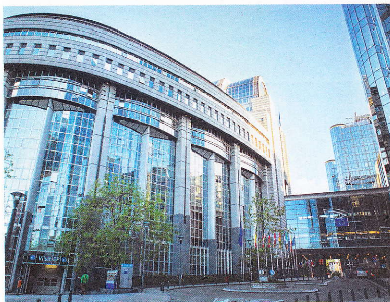
Sede del Parlamento europeo a Strasburgo

Comunità economica europea si è arrivati, attraverso diverse tappe intermedie, al trattato di Lisbona del 2007 che è la base su cui funziona l'Unione attuale.