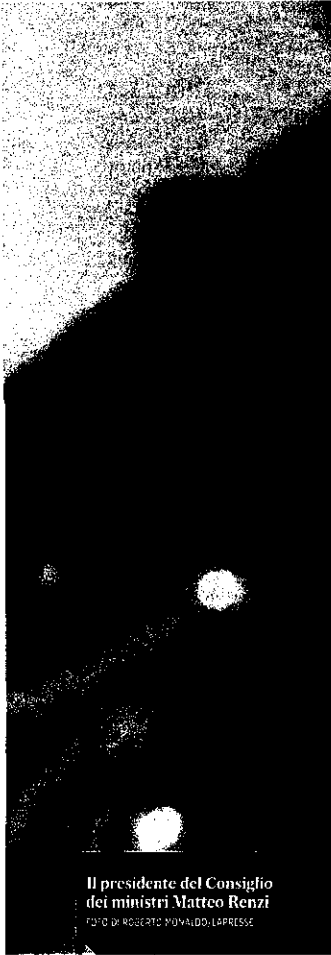
Il presidente del Consiglio dei ministri Matteo Renzi

La Uil lunedì nel suo esecutivo - con all'ordine del giorno la presentazione delle tesi per il congresso di novembre - farà il punto sulla riforma del lavoro. Ma condivide la posizione di Cisl e Uil: serve una trattativa con il governo.