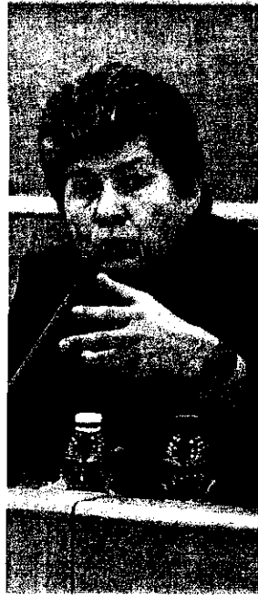
Susanna Camusso

La leader di Corso d'Italia: «Renzi dice che non si iscriverà mai alla Cgil? Commette un errore»