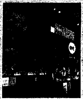
Bono al congresso del Ppe a Dublino